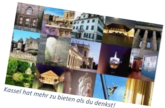
Kassel hat mehr zu bieten als du denkst!

Klicken oder tippen Sie hier, um Text einzugeben.