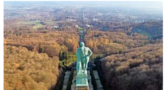
Eines der Kassler Wahrzeichen: Herkules im UNESCO Welterbe

Klicken oder tippen Sie hier, um Text einzugeben.